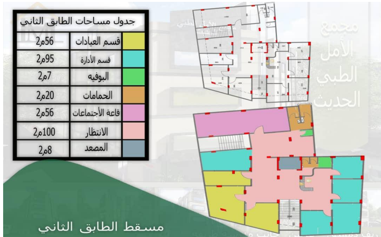
الشكل (5) مسقط الطابق الثاني لمركز الأمل الطبي

المصدر: بالتعاون بين الباحثة والمهندس حمدي أحمد حمود المسؤول المفترض عن مشروع إنشاء مركز الأمل الطبي