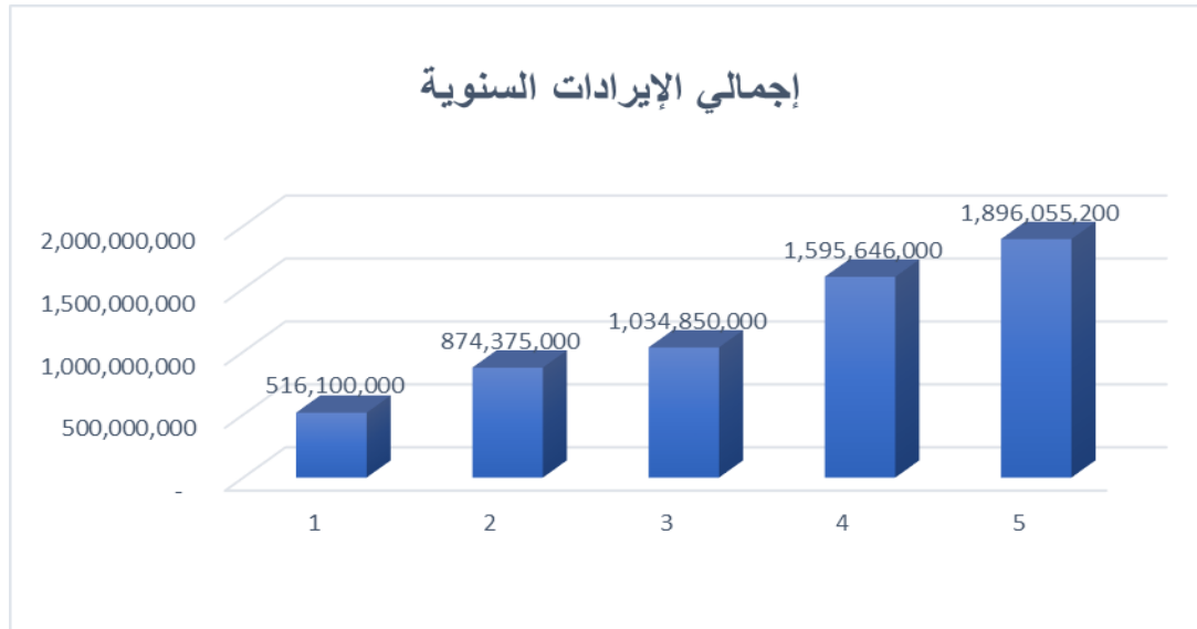
الشكل رقم (6) إجمالي الإيرادات السنوية لمركز الأمل الطبي خلال خمسة أعوام