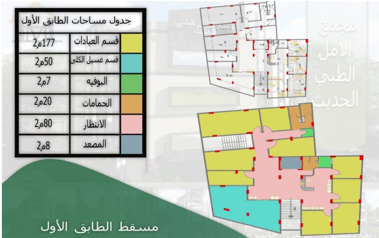
الشكل (4) مسقط الطابق الأول لمركز الأمل الطبي